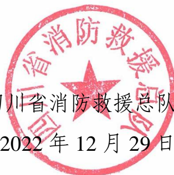
四川省消防救援总队