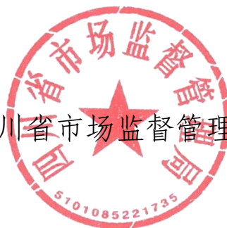
四川省市场监督管理局